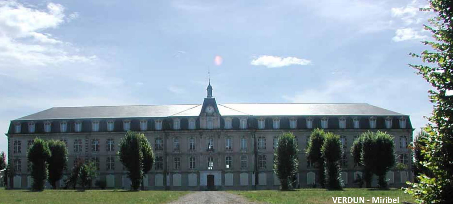
VERDUN - Miribel