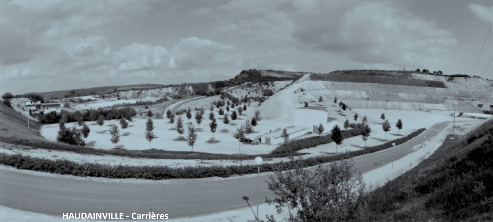
HAUDAINVILLE - Carrières